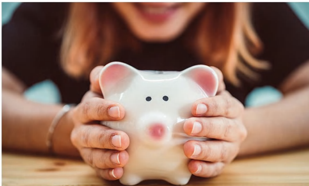
Dispositif "Argent de poche"